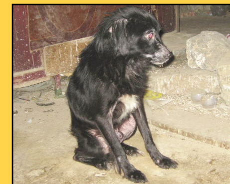
Duque en el momento en que fue rescatado

Este perrito es Duque, que tras recuperarse del infierno vivido y estar en una casa de acogida fue felizmente adoptado en Alemania.