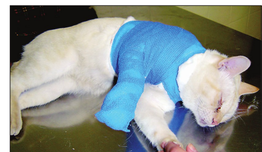
Imagen de Camilo en casa, recuperándose después de la operación.

Diversas imágenes de Camilo, que tuvo que ser operado hasta en tres ocasiones de diversas fracturas.